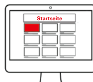
TextAd Pos. 1