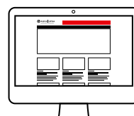
Leaderboard (nur Desktop)