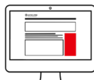
Halfpage Ad (nur Folgeseiten)