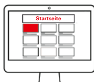
Spons. Content Teaser Pos. 1 (inkl. Inhaltsseite)

Gilt für Formate: GIF/JPEG/Richmedia: max. 300 KB; sonstige Formate: HTML5