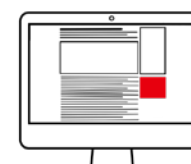
Rectangle (nur Folgeseiten)