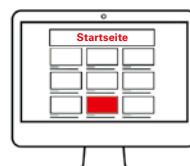
Spons. Content Teaser Pos. 2 (inkl. Inhaltsseite)