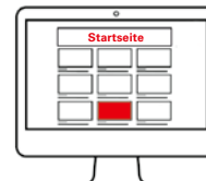
TextAd Pos. 2